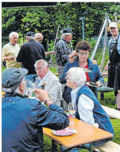
Am Silberfuchs verspricht jetzt das Rebblütenfest jede Menge gute Unterhaltung.

Es heißt, dass der Wein nicht nur ein Getränk ist, sondern ein Kulturgut, das die Menschen zusammenbringt, sie anregt, miteinander zu reden und sich kennenzulernen. Beim Rebblütenfest war das ganz sicher der Fall.